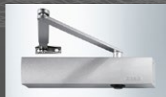
samozamykacz GEZE TS 4000