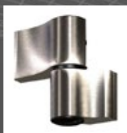
zawias WALA WS inox